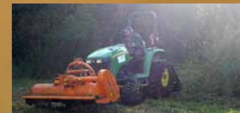
Les travaux ont été réalisés par une entreprise spécialisée avec du matériel à faible portance adapté aux zones de marais.

En mai, juillet et septembre 2014, des layons ont été créés puis entretenus par broyage mécanique en partenariat avec les chasseurs pour faciliter le cheminement dans la réserve. Afin d'éliminer les rejets de saules et d'aulnes aux abords de l'étang, un broyage mécanique a été réalisé en septembre 2014. L'objectif de ces travaux est d'éviter le comblement du plan d'eau et de le remettre en lumière afin de favoriser le développement de la flore aquatique.