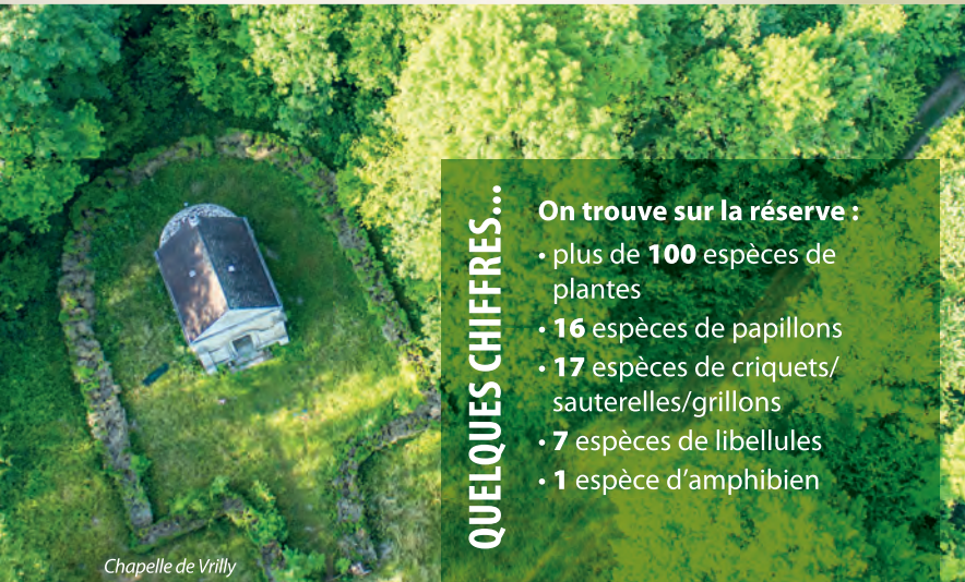
Chapelle de Villy