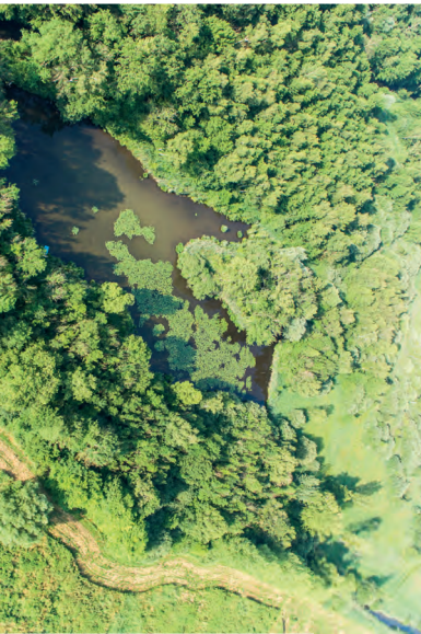
L'étang aux carpes

La Réserve Naturelle du Marais des Trous de Leu joue un rôle prépondérant dans la sensibilisation du public aux enjeux environnementaux et à la préservation de la biodiversité. Le Conservatoire étudie actuellement les possibilités d'ouvrir ce site naturel protégé au public et d'en faire un espace dédié à l'éducation à l'environnement. L'objectif est de proposer des aménagements pertinents et adaptés au contexte local dans le respect du site.